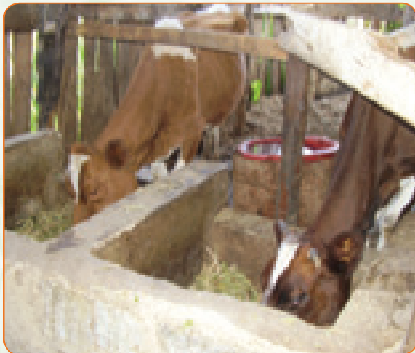
Ng'ombe wakila majani ya mihogo yaliyokaushwa