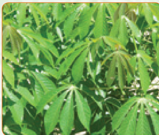
Majani ya mhogo