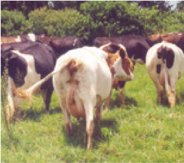
Mifugo wenye afya