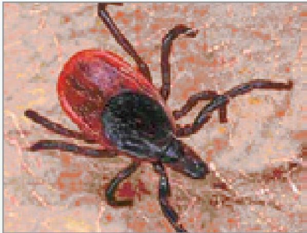
Kupe wa hudhurungi wa sikio

Unasababishwa na wadudu walio sawa na wale wanaosababisha malaria kwa binadamu. Wadudu hao huambukizwa miongoni mwa wanyama kupitia kwa kupe wa hudhurungi (hushikilia karibu masikioni mwa wanyama).