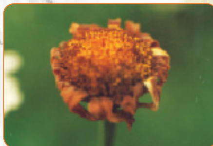
Maua yalifumuka zaidi kiwango cha 1.1