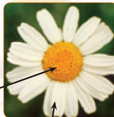
Maua ya ndani