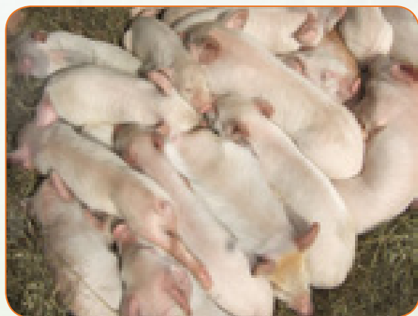
Kuimarishwa kiwango cha kutokufa