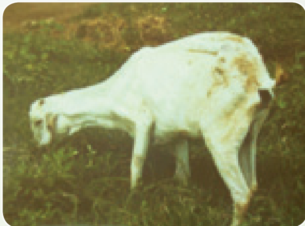
Mbuzi mwenye nimonia

LAT ikichanganywa na utambuzi wa dalili zilizotajwa hapo juu inaweza kuthibitisha kuwepo kwa nimonia kwa dakika 5.