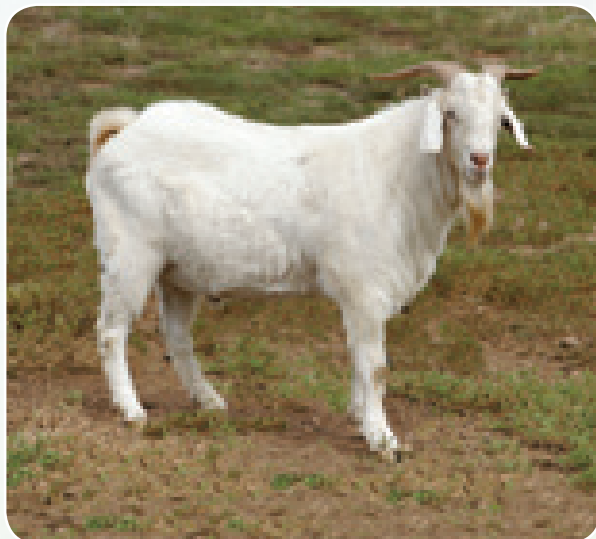
Mbuzi mwenye afya