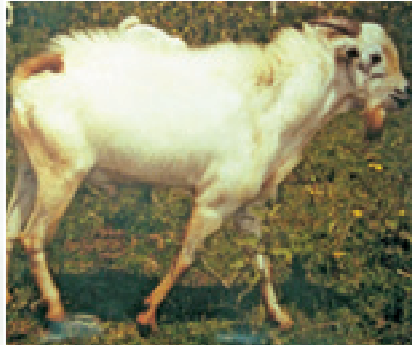
Mbuzi mwenye afya bora

LAT ikichanganywa na utambuzi wa dalili zilizotajwa hapo juu inaweza kuthibitisha kuwepo kwa nimonia kwa dakika 5.