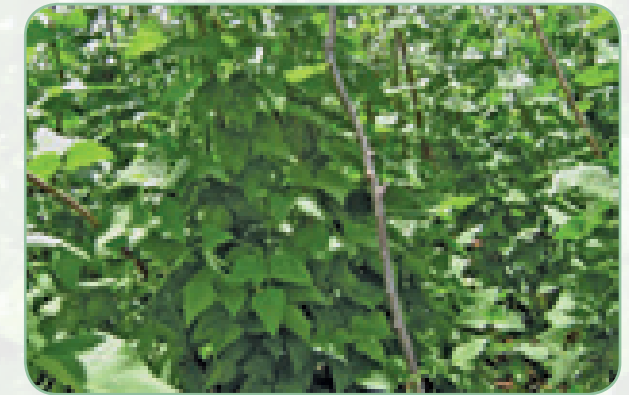
Kijiti kwa kila mmea