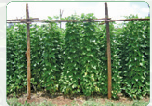
Vifaa vya kushikilia ni kama waya, uzi na nguzo