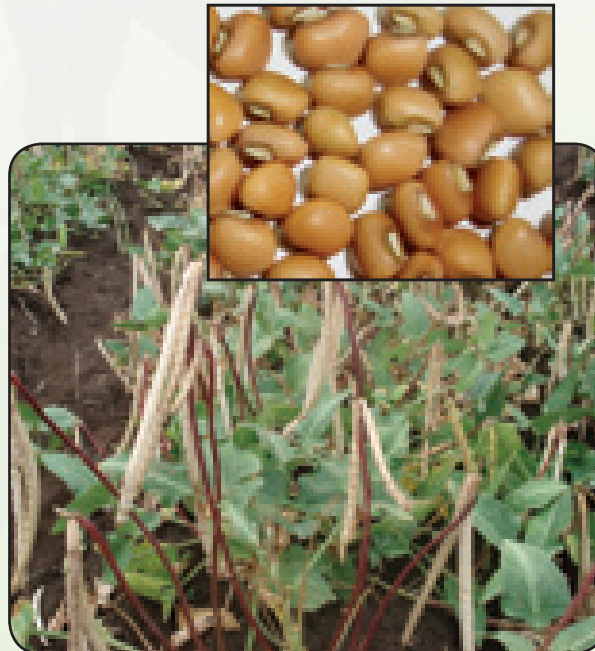
Cowpea K80 (silvery mid rib)