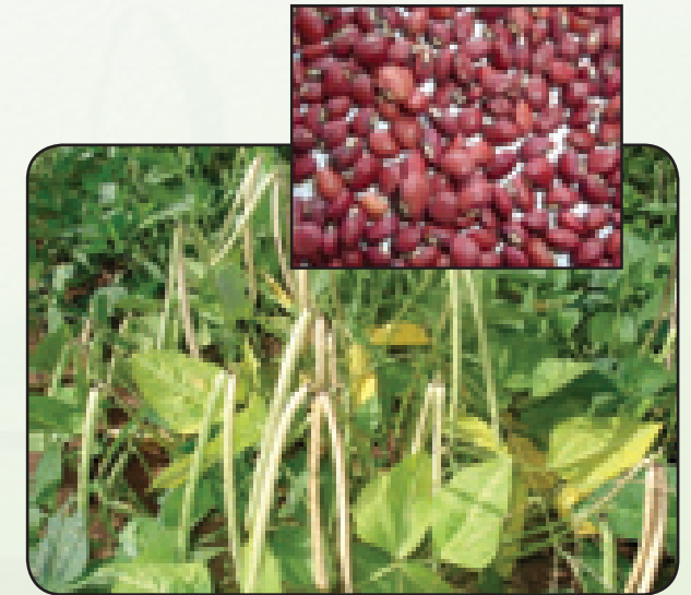
KVU 27-1 (Majani yenye pembe kafi)