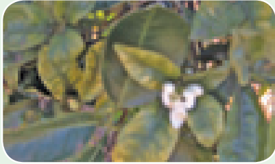
Ugonjwa wa kijani kibichi

Huu ni ugonjwa unaosababisha matawi kuwa ya manjano. Matunda huwa madogo yaliyobonyeka. Mti waweza kunawiri bali na msimu. Huambukizwa na mdudu aitwaye 'pyslid'.