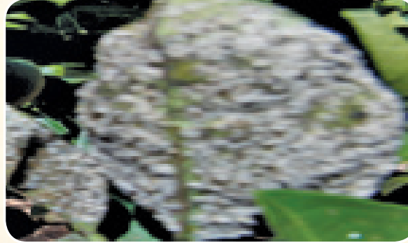
Wadudu wenye manyoya wakiwa juu ya tawi

asali nyingi na kusababisha uimbukaji wa magonjwa ambao hufanya matawi kufa na kuyapoteza matunda.