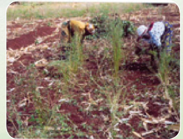
Ung'oaji wa Crotalaria iliyochanganywa na mimea

Ng'oa au ukate mbolea ile ya kunde baada ya kuvuna mahindi.