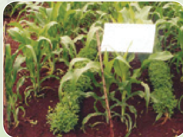
Mseto wa mahindi na Crotalaria shambani

Panda mimea hivyo ilivyo kama kunde siku moja au wiki 2 baada ya mahindi na usitumie mbolea ya nitrojeni kwa majani hayo ya kunde.