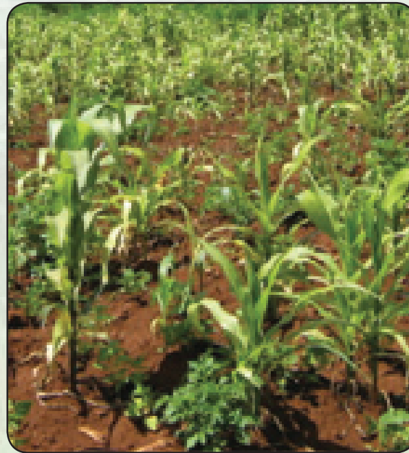
Shamba lenye kuathiriwa sana

Upandaji wa mimea yenye kuathiriwa hupunguza matokeo ya mazao kwa kiwango cha nusu ya uwezo wa matokeo.