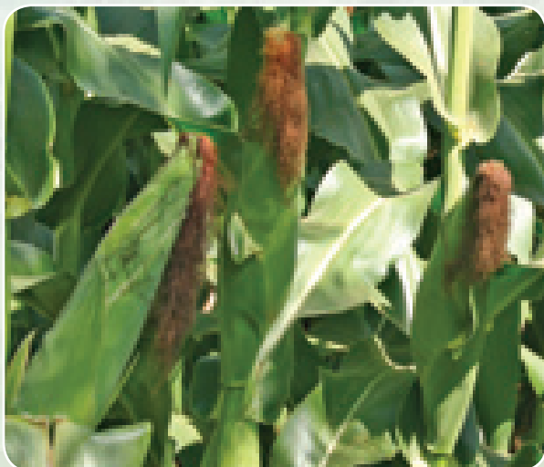
Mahindi yenye afya bila ugonjwa

Aina hizi zinaweza kupatikana kutoka kwa kampuni zinazouza mbegu kama Freshco, Faida seeds, Leldet na 'East African Seed Company'.