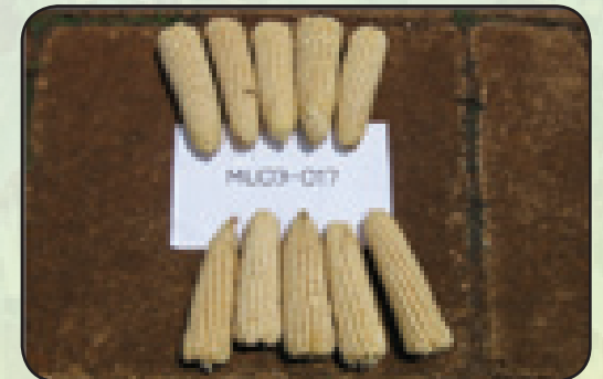
Aina za mahindi zinazostahimili