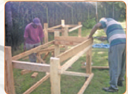
Kupaka fremu rangi

Rangi hupakwa baada ya uundaji wote kukamilika. Rangi nyeupe ya maji inatiwa kwanza kisha kuachwa ikauke siku moja na kufuatiwa masaa na rangi ya pili. Baada ya masaa manne, rangi ya mafuta inapakwa kisha kukaushwa kwa siku moja.