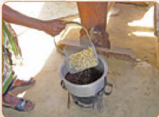
Kukaanga na mafuta