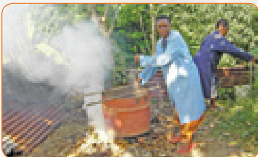
Kuosha na mafuta moto