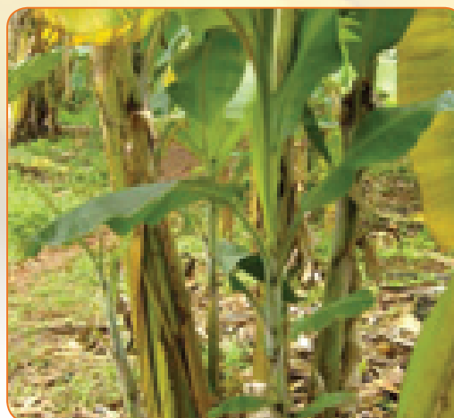
Mpasuko wa mihili wa ndizi

Katika hali zingine, pande za nje za jani na za undani hupasuka kutoka juu hadi chini karibu na kuliko mchanga.