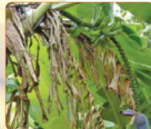
Tira ndogo la ndizi zilizokomaa kwenye mmea ulioathirika

Mmea ulioathiriwa hauwezi kukua vyema ili kukuza matunda yaliyokomaa na ugonjwa huwa unaweza kusababisha kufa kwa mimea kabisa, kama picha inavyoonyesha.