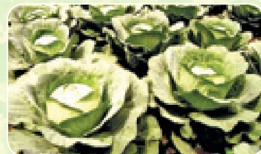
Mmea ulionawiri wa kabeji