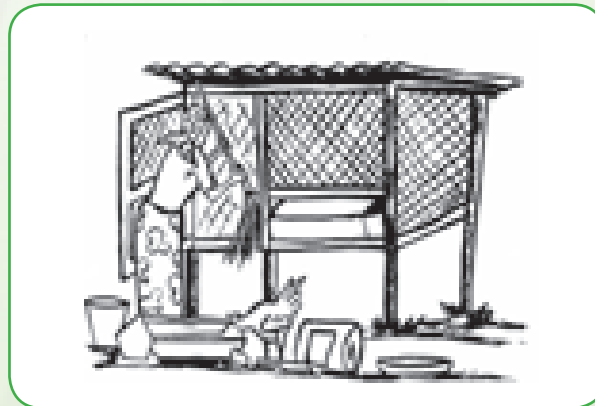
Makaazi ya sakafu ya mianya

Nyumba huinuliwa nusu mita kutoka kwenye ardhi ili kinyezi cha kuku kianguke chini. Sakafu hutengenezwa kwa kutumia miiti iliyoachana au waya ngumu. Weka kuku kumi kwa kila mita jumla.