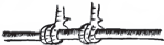
Mahali pa kutua

Mahali pa kutua ni muhimu kwa kuku kupumzikia ndani ya makaazi. Hutengenezwa kwa miti ya mviringo ya kimo wastani. Kila mti wa kupumzikia unaweza kutumika na kuku wazima watano.