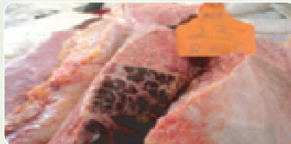
Mapafu yenye alama alama