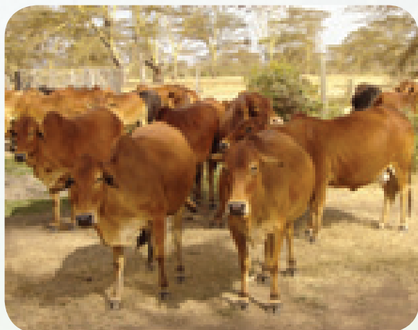
Mifugo wenye afya

Unapohamisha mifugo kutoka sehemu moja hadi nyingine, pata kibali cha kusafirisha kutoka kwa serikali.