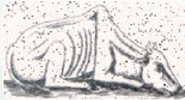
Shingo lililofutwa nje dalili ya CBPP