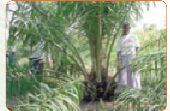
Miti iliyo tolewa majani

Katika mashamba yenye umri chini ya miaka 5, toa majani yaliyokufa. Kwa mashamba ya zaidi ya miaka 5, wacha manjani mawili chini ya tifa la matunda.