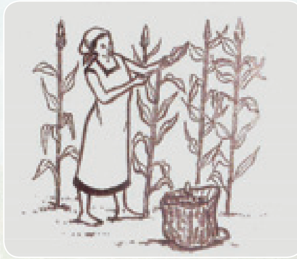
Uvunaji mimea wa mwanzo

Vuna mimea ya kwanza kwa kukata sehemu iliyo komaa na kuacha mihimili inayosimama.