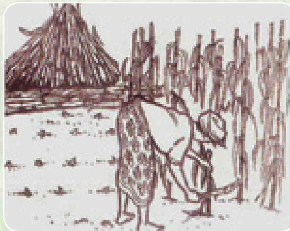
Ukataji tena wa mihimili

Juma moja baada ya kuvuna, ikate tena mihimili ya mtama, kiwango wastani kutoka mchangani na itanawiri upya. Usisubiri hadi mimea ikauke.