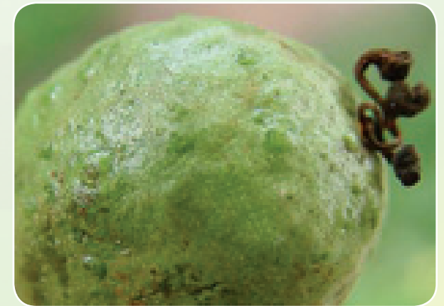
Athari za thrip kwa funda la kundi