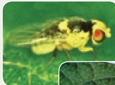
Mdudu wa matawi

Mdudu huyu huchangia asilimia 27 ya mazao yanayokataliwa. Mimea inayoathiriwa sana ni mau ( Gypsophilla, carnation, cathamus, pelargonium ) matumba ya mbegu za maharagwe ya kifaransa na Snow peas .