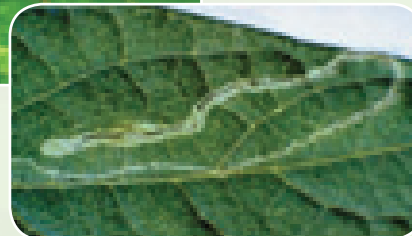
Athari za mdudu wa matawi