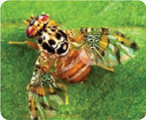
Mdudu wa matunda

Mdudu huyu huathiri matunda ya maembe na avocado.