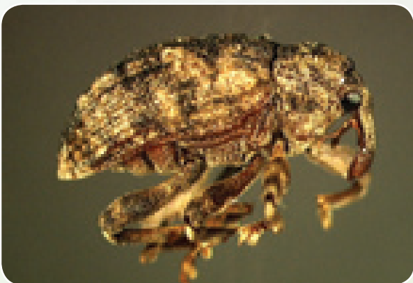
Mdudu wa mbegu ya maembe