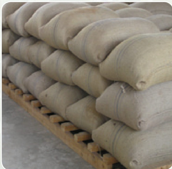
Mazao mazuri ya mahindi ghalani