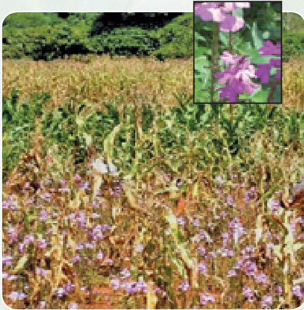
Mahindi yaliyovamiwa na striga

Ukuzaji wa mahindi Magharibi mwa Kenya unaathiriwa sana na magugu ya striga (khayongo). Kiwango kikubwa cha magugu hayo kinaweza kusambaratisha mazao yote.