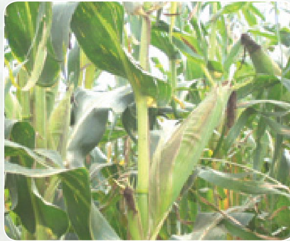
Mahindi ya KSTP 94

Mbegu hii imebuniwa kutokana na aina zilizoko maeneo ya Magharibi mwa Kenya. Aina ya KSTP94 inaonekana kunawiri vizuri katika maeneo yaliyovamiwa na mmea wa striga ikilinganishwa na aina zingine za mahindi.