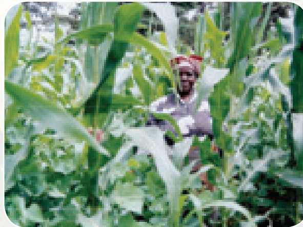
Mahindi yamekuzwa na mimea mingine