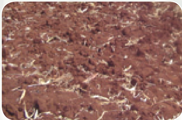
Ardhi ilivyotayarishwa vizuri

Hili ndilo jambo la kwanza na muhimu katika kuangamiza kwekwe. Huanzia na kuondoa vichaka vichaka baada ya kulima na plau na kuchimbua. Katika kuchimbua hata kulima kwa kiwango cha chini, dawa ya kuangamiza kwekwe hutwiwa.