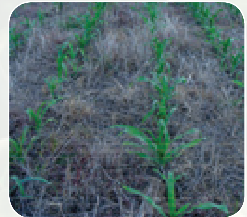
Dawa zinazoua kwekwe wakati kwekwe zimemea

Ili kutumia dawa hizi ifaavyo, ujuzi na vifaa mwafaka ni muhimu.