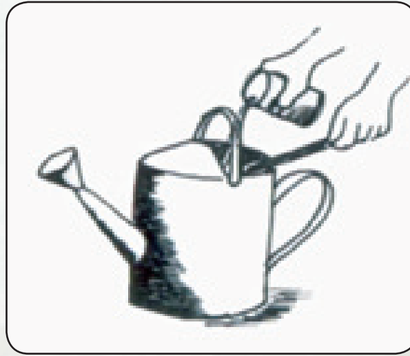
Ndoo ya maji