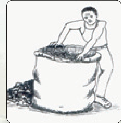
Kujaza na kushindilia majani katika mfuko wa plastiki

Yatie majani kwenye mfuko wa plastiki ngumu yenye upana mkubwa (kiwango cha kati ya mita 1.5 hadi 2 kilichofungwa upande mmoja na kamba za mkonge).