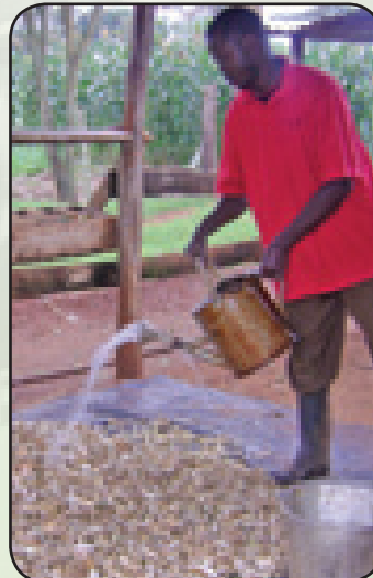
Kunyunyizia mseto kwenye majani

Weka kati ya lita 4 hadi 5 za maji kwenye ndoo ya maji kisha upime gramu 400 hadi 500 za mbolea aina ya urea na uchanganye na maji (mbolea ya urea huchanganyika mara moja).