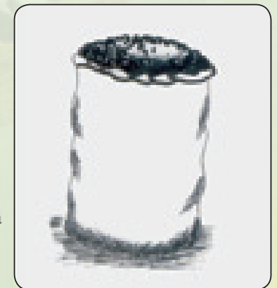
Chakula kwenye mfuko wa plastiki