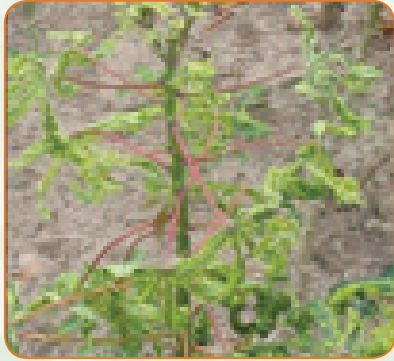
Virusi vya Cassava mosaic

Wakulima wengi wa pwani ya Kenya hupanda mihogo ya kawaida ambayo hutoa mazao duni na husumbuliwa na maradhi. Magonjwa sugu katika sehemu hizi huwa virusi vya cassava brown streak na cassava mosaic .