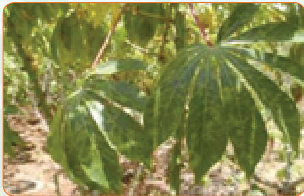
Virusi vya Cassava brown streak

KARI-Mtwapa imeibuni aina sita za mihogo ya mazao ya juu yenye kustahimili maradhi sugu. Aina hizi zinaweza kutoa tani 20 hadi 28 kwa kila ekari, ikilinganishwa na aina ziliziko zenye mazao kati ya tani 4 hadi 14 kwa kila eka.